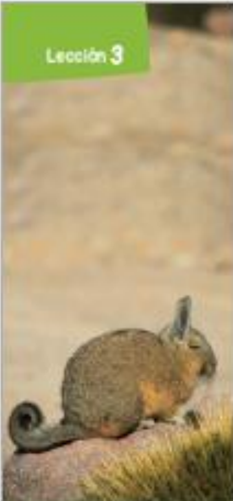
• Vicuña, mamífero del altiplano chileno.